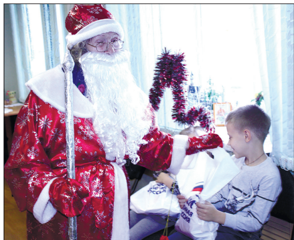
Дед Мороз вручает подарки детям.