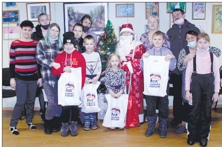
Снимок после вручения подарков от «Единой России».