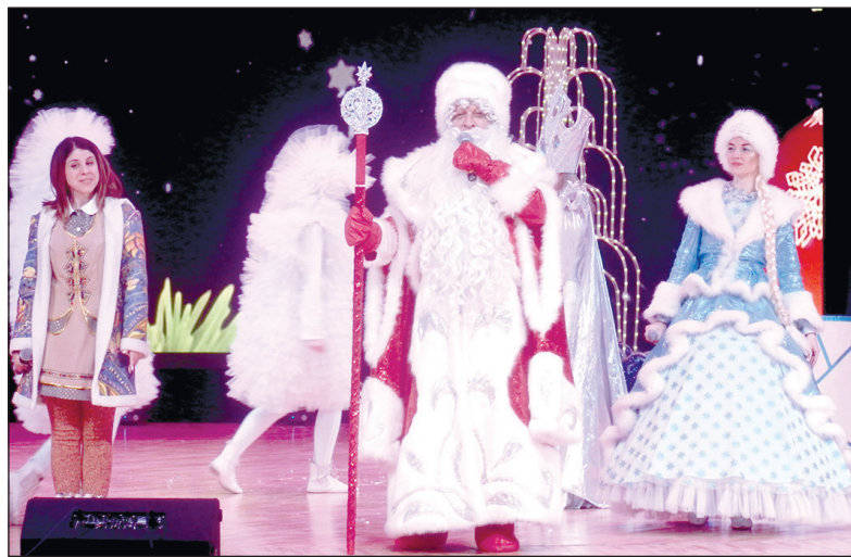
Дед мороз и Снегурочка в праздничном спектакле в Центральном дворце культуры г. Белово накануне Рождества Христова.

5 января, накануне рождества Христова, по многолетней традиции Беловское местное отделение партии «Единая Россия» совместно с Беловской городской организацией Всероссийского общества инвалидов провели благотворительную акцию, устроили праздничное новогоднее представление в Центральном дворце культуры. Детям было предоставлено интерактивное представление «Тайна волшебного зеркала, или невероятные новогодние приключения!» по мотивам сказки «Снежная королева».