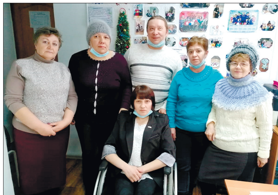
Активисты Ленинск-Кузнецкой организации ВОИ после проведения отчетно-выборной конференции.