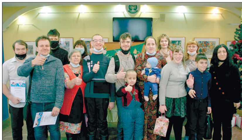
Все дети в Кемеровской городской организации ВОИ получили призы и Новогодние подарки.

за гончарным кругом. Это благодаря его стараниям ребята смогли достичь таких успехов. И мы поздравляем всех участников семейного клуба с окончанием курса, желаем дальнейших творческих успехов, новых достижений и исполнения загаданных желаний! До встречи в новом 2021 году!