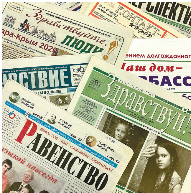
Многие региональные организации ВОИ издают свои газеты.