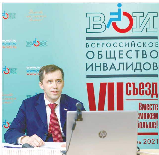
Председатель ВОИ Михаил Борисович Терентьев.

Кроме того, приветственные адреса поступили от Совета Федерации РФ, Минтруда России, Минздрава России, Пенсионного фонда России,