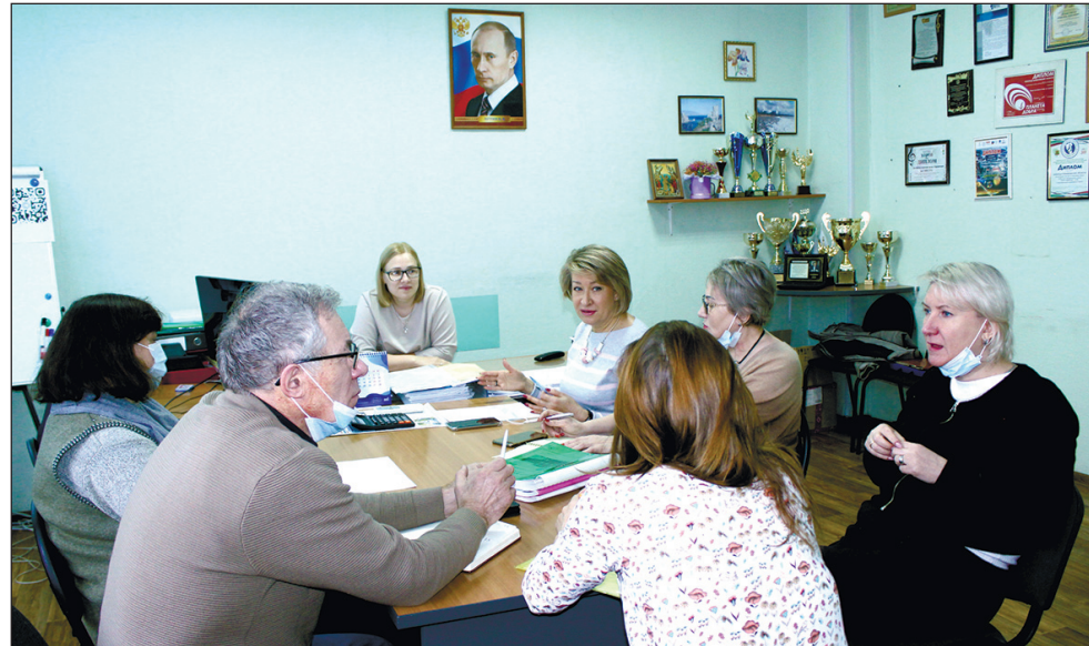
В офисе Кемеровской областной организации ВОИ состоялся круглый стол, рассмотревший проблемы доступной среды в Кузбассе и паспортизацию объектов по доступности.