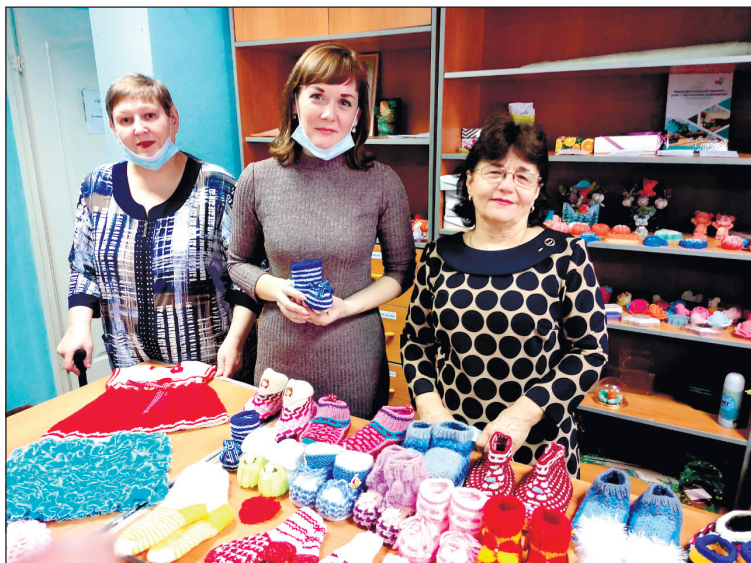
Выставка-продажа детских скороходов.