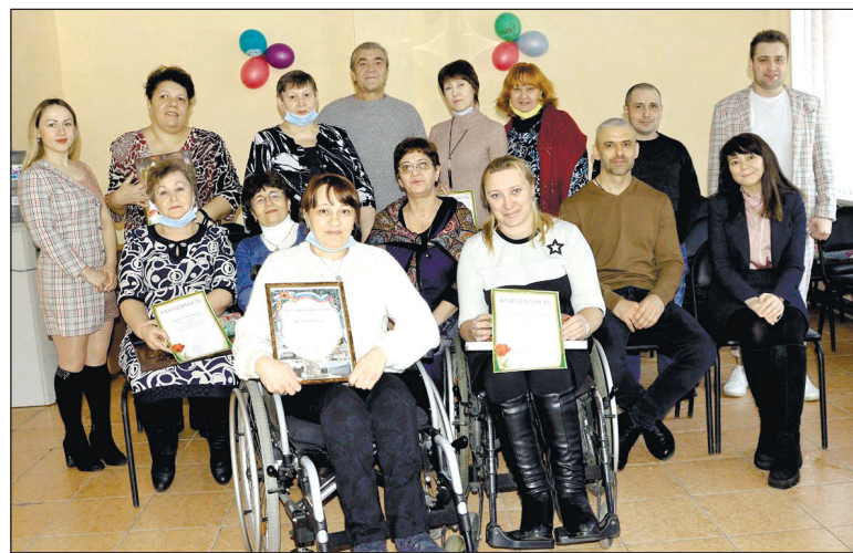
После награждения - снимок на память.

С добрыми пожеланиями за общим праздничным столом члены общества получили сувенирную продукцию и коробки с шоколадными конфетами. Администрация ЛКГО ВОИ подготовила для активистов общества Почетные грамоты, а для наших благотворителей Благодар-