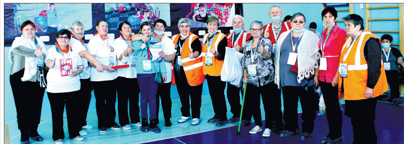
Больше всего представителей было от Бачатской организации ВОИ, они заняли 5 место.