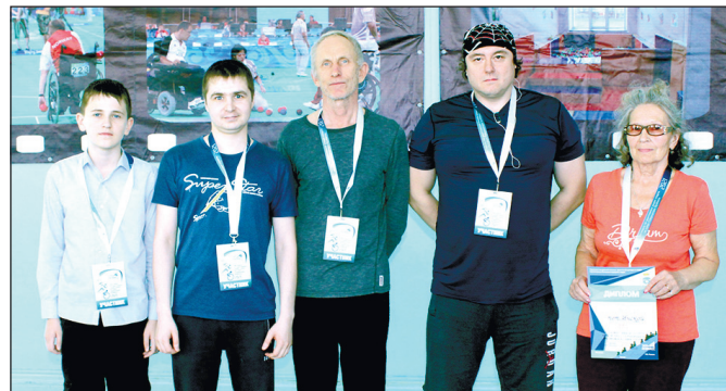
Спортсмены Инской организации ВОИ на 2 месте.