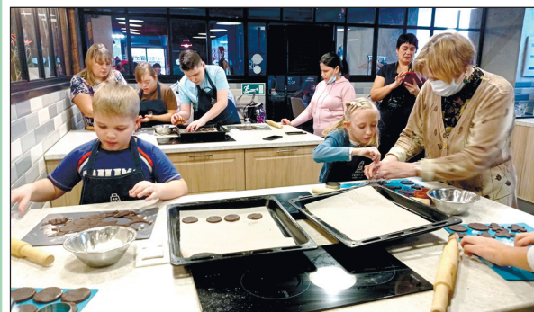
В семейном клубе «Образ» мастер-класс по изготовлению шоколадного печенья.

Семейный клуб «Образ» - это проект Прихода Воскресения Христова г. Кемерово, который реализуется при финансовой поддержке Фонда президентских грантов.