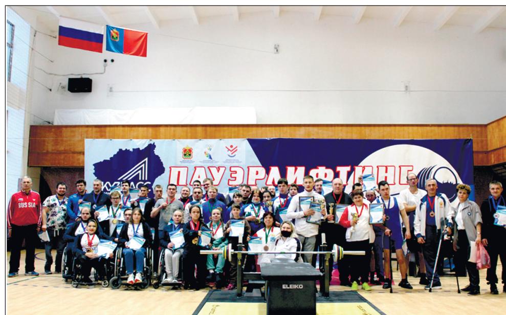
Участники соревнований по пауэрлифтингу в Новокузнецке.

По информации ГБУ "РЦСП Кузбасса по адаптивным видам спорта".