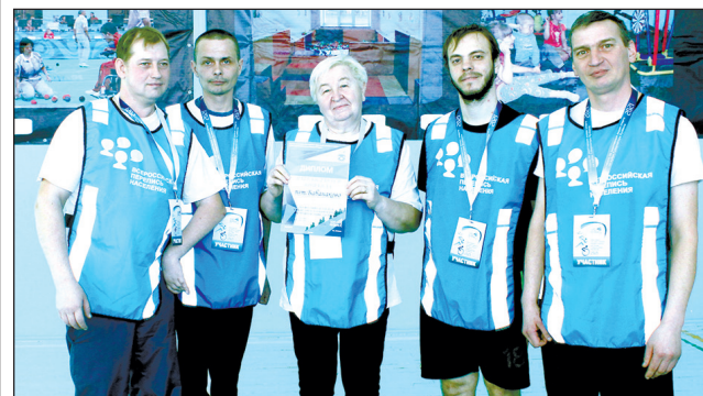
Бабанаконцы завоевали 1 место.