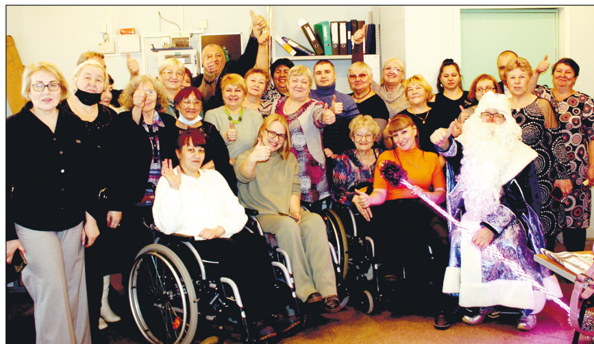
Общий снимок с Дедом Морозом после конференции.