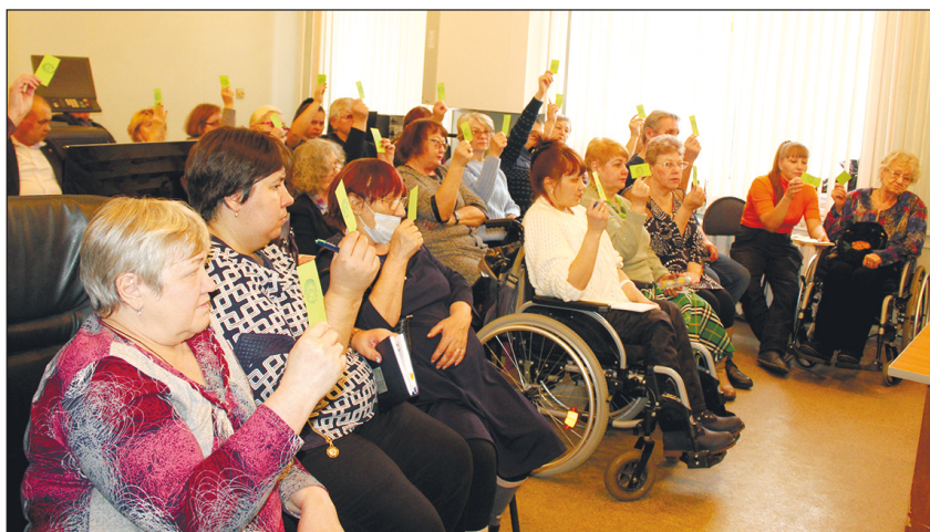
За избрание контрольно-ревизионной комиссии организации делегаты проголосовали единогласно.