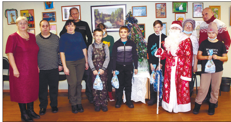
Все дети членов Беловской организации ВОИ получили подарки от партии «ЕДИНАЯ РОССИЯ».