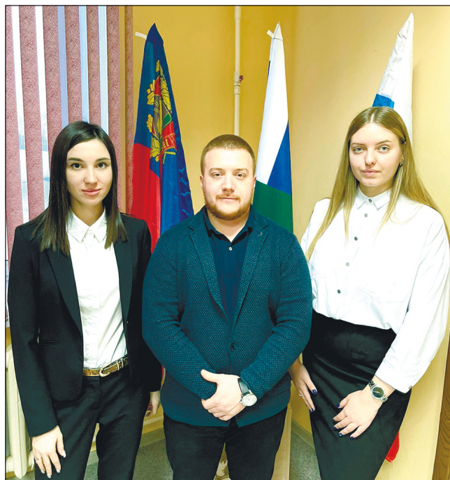
Молодые следователи Следственного комитета.