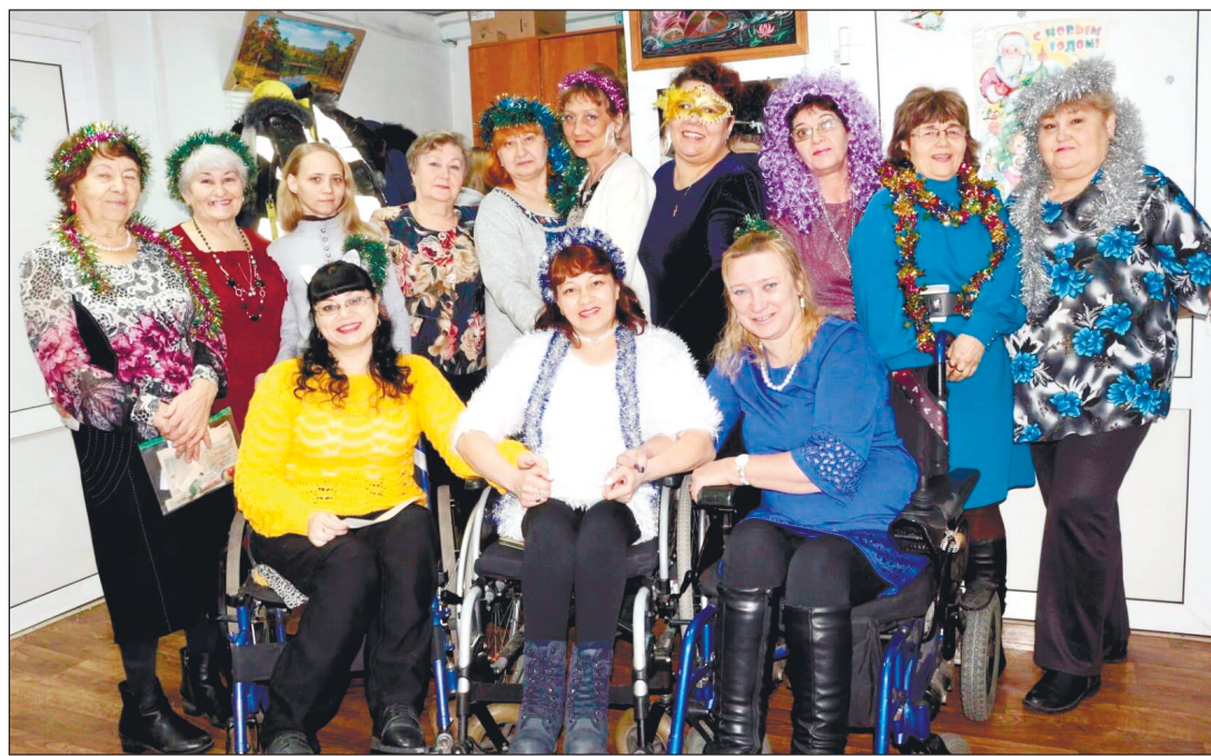
В Ленинск-Кузнецкой организации ВОИ празднование Нового года решили провести в форме «Новогоднего огонька» совместно с организацией ВОС.