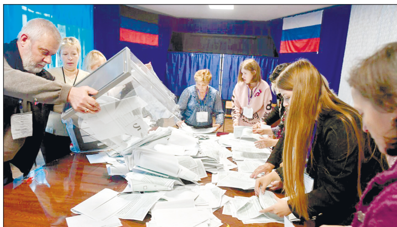
Идет подсчет голосов на избирательном участке ДНР.

Во всех четырех регионах референдумы были признаны состоявшимися уже по итогу третьего дня голосования, когда явка везде превысила 50%. Основной отличительной особенностью референдумов стало то, что итоговые показатели явки рассчитывались от численности избирателей в списках на момент окончания голосования. Это связано с тем, что на участках, которые образованы за пределами регионов, списки составляются «с нуля»: в них вносятся избиратели, явившиеся для голосования и предъявившие необходимые документы. Кроме того, на освобожденных после 24 февраля территориях в составе ДНР и ЛНР избирательные списки на момент начала референдумов были предварительными и теперь пополняются по мере того, как люди, имеющие