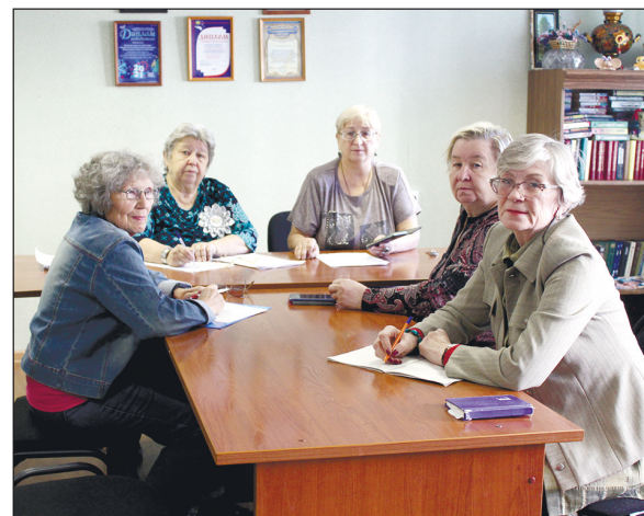
Идет заседание правления Беловской городской организации ВОИ.