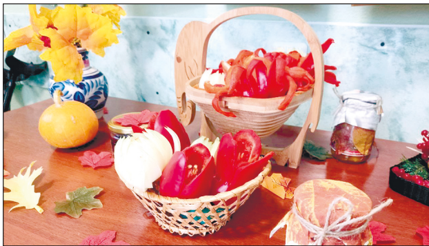
Натюрморт из «Даров золотой осени».

Осень – самое красочное и плодородное время года. Члены нашей городской организации ВОИ решили не упускать такой момент и поделиться своей радостью от урожая, организовав выставку «Дары золотой осени». Здесь были представлены необычные экземпляры того, что анжеросудженцы вырастили на своих участках: тыквы, патиссоны, редька дайком, помидоры интересных сортов. Часть собранных плодов уже превратились в запасы: баночки с ароматным вареньем, тыквенным соком или яблочным повидлом, часть пока только ждет своей очереди, а пока радуется глаз на выставке.