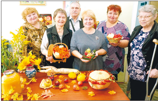
Урожай, выращенный своими руками.