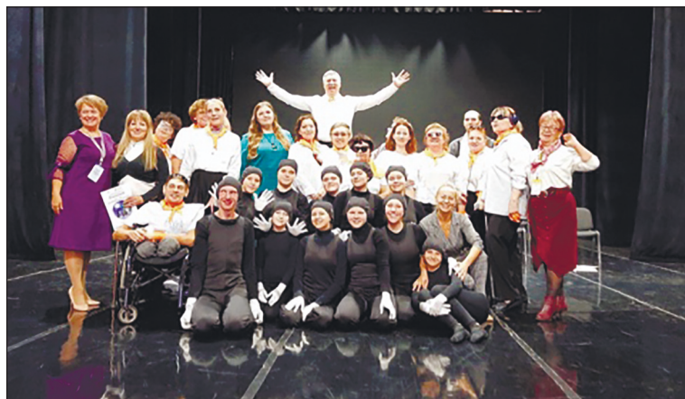
Артисты PRO-театра «Крылья» после спектакля.