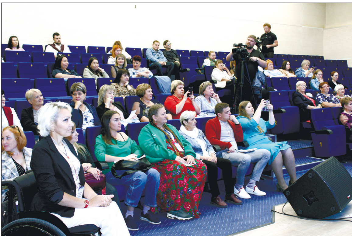
Идет форум по социально-культурной реабилитации инвалидов «Креативные индустрии без ограничений».

Студия организована для людей любых возрастов. Главное - желание заниматься танцами.