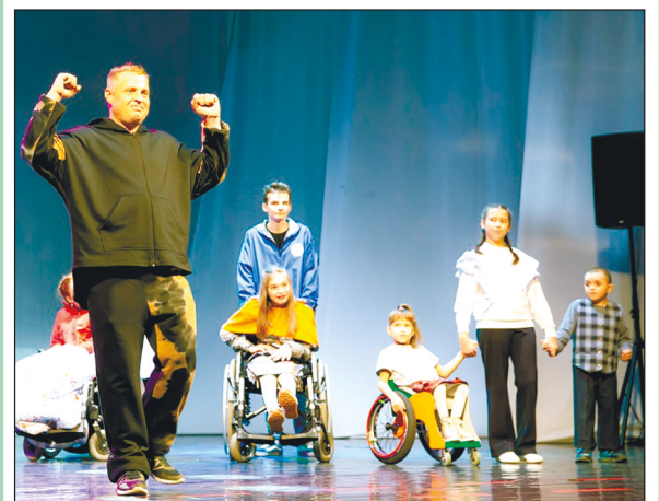
В показе моделей одежды от компании «Ортомода» приняли участие дети и взрослые, члены КОО ООО «Всероссийское общество инвалидов».