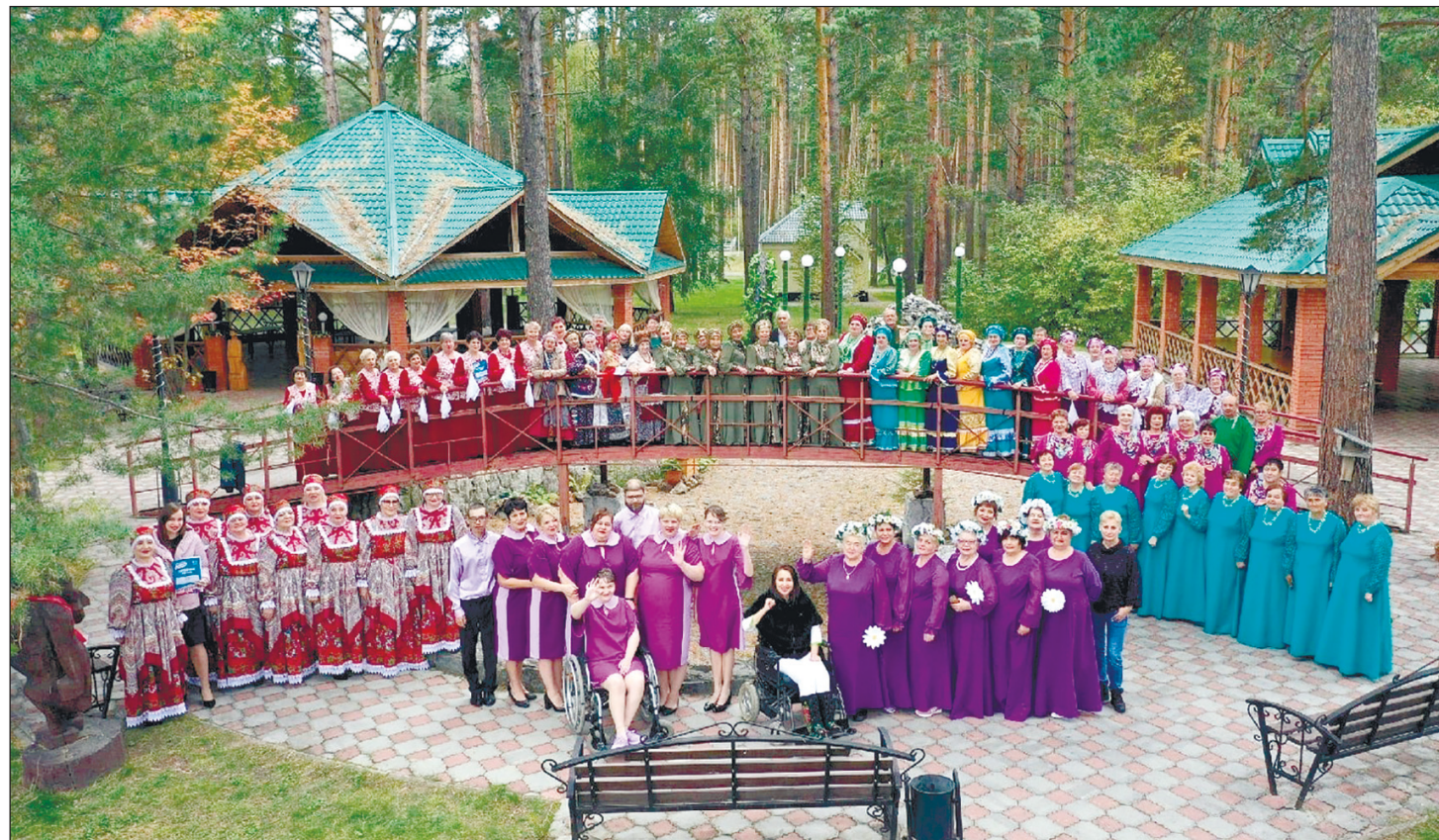
Общий снимок финалистов фестиваля-конкурса «Битва хоров» 2022 года в Томске на базе отдыха в Центре «Томь».

По информации Томской областной организации ВОИ.