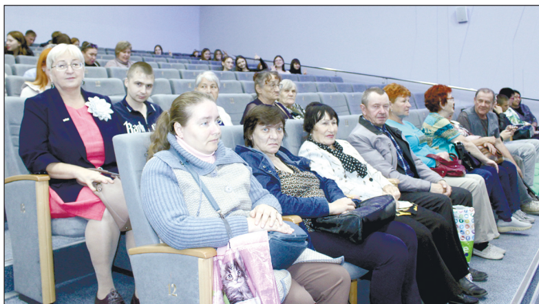
На спектакль пришли члены Беловской организации ВОИ.