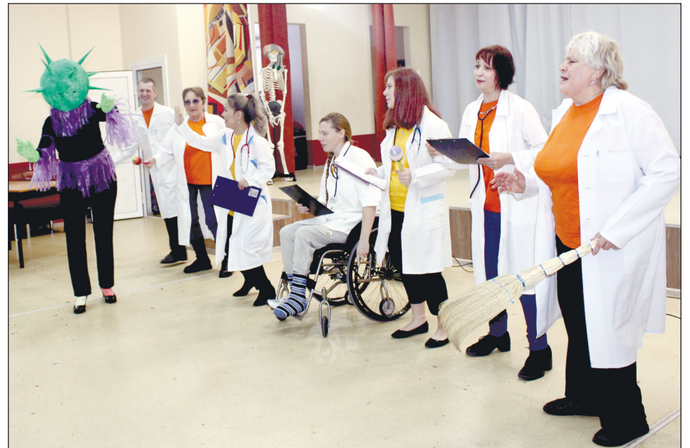
Выступает команда «Свои люди» из Междуреченска.