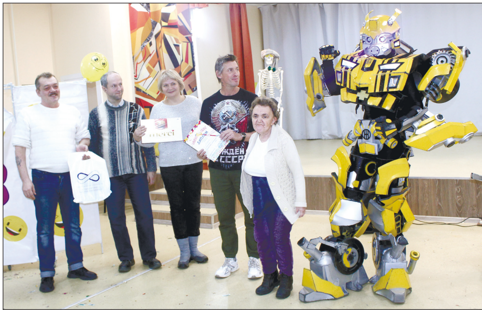
Команда «Дерзкие» из Юрги с Киборгом, пришедшим в гости на ИНВА-КВН.