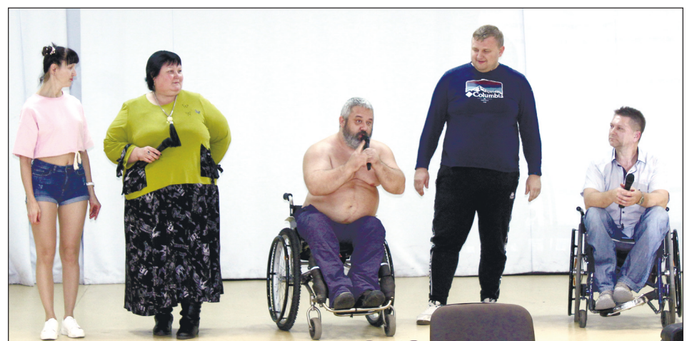
Выступает команда «Капитан очевидность» из Прокопьевска.