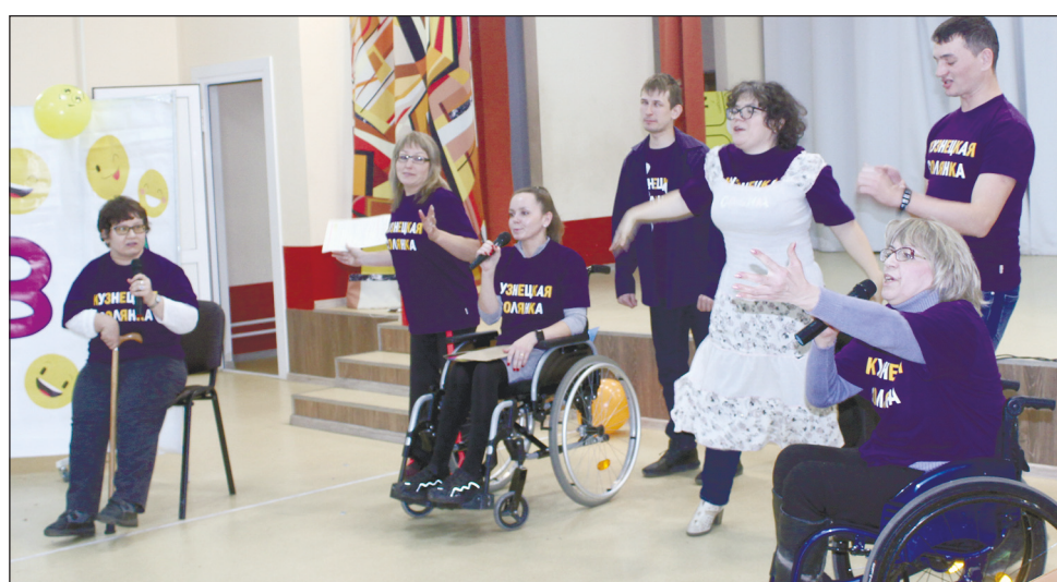
Выступает команда «Кузнецкая солянка» из г. Новокузнецка.