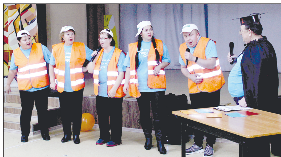
Выступает команда «Шпалы» из г. Тайги.