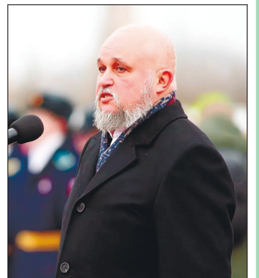
Выступает губернатор Кузбасса Сергей Цивилев.

В день открытия на мемориальном комплексе высадили кедровую Аллею Героев России. Она будет продол-