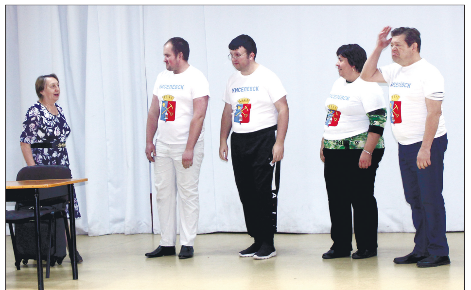
Выступает команда «Звезды надежды» из Киселевска.