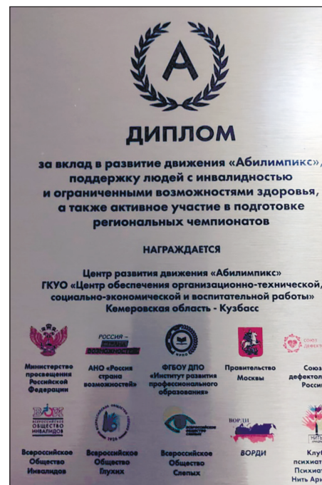
Диплом команде из Кузбасса.