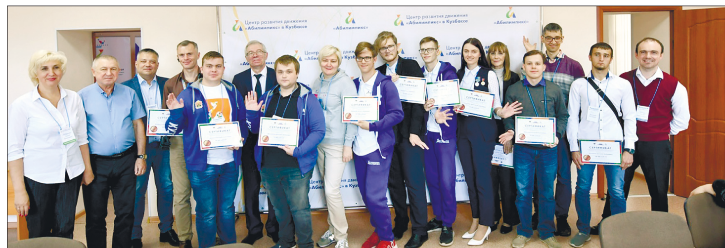
Участники конкурса профессионального мастерства с руководителями организаций инвалидов Кузбасса.