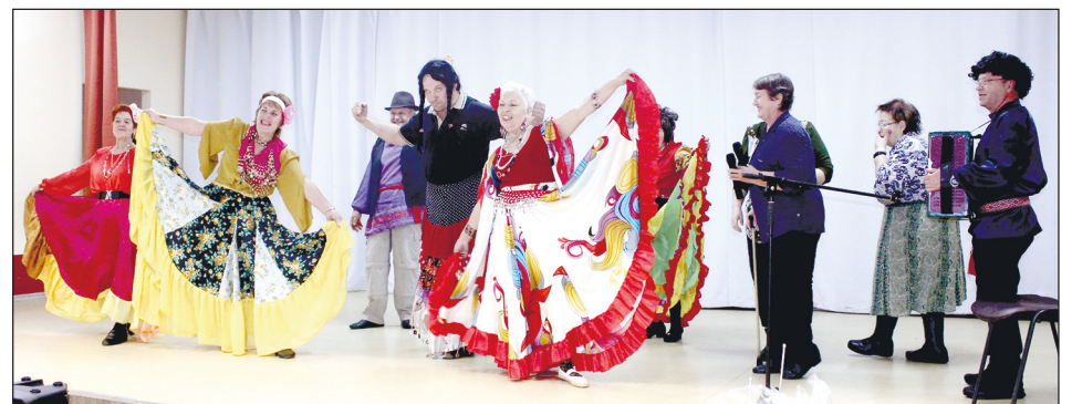
Выступает команда «Кузнечики» из Новокузнецка.