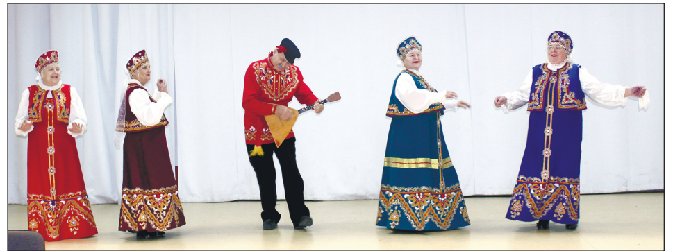
Выступает команда «Перпетуум мобиле» из Белово.