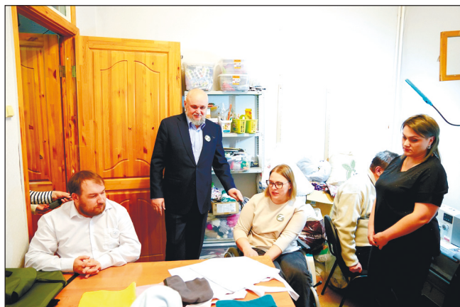
Губернатор Кузбасса С.Е. Цивилев в гостях у членов Кемеровской областной организации ВОИ.

Пресс-релиз Администрации Правительства Кузбасса.