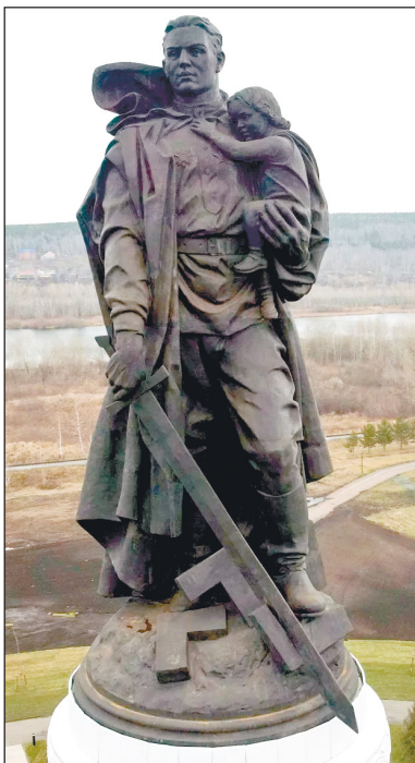
Памятник воину-освободителю в Кемерово.

Тогда и было принято решение вернуть символ Победы на родину. Возможность использования художественного образа согласовали с законным обладателем авторских