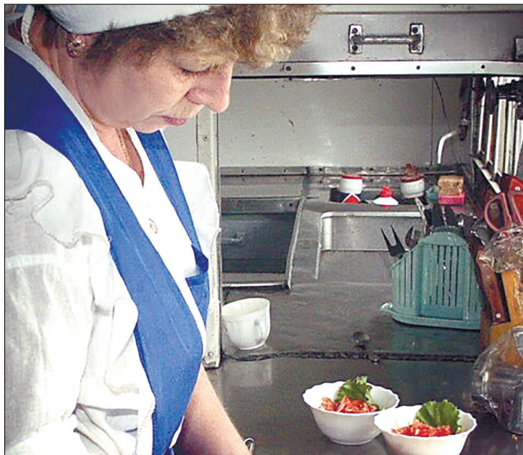
Социальный проект - в жизнь!