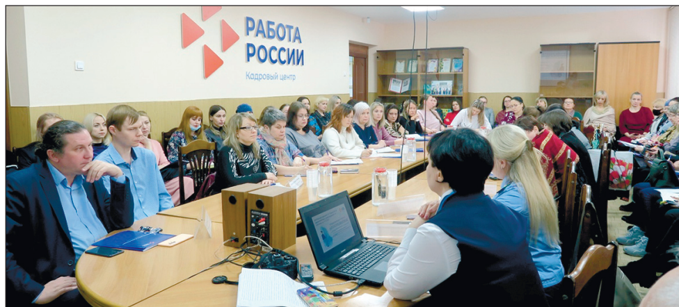
В кадровом центре «Работа России» города Новокузнецка идет заседание по теме «Занятость людей с инвалидностью. Квотирование рабочих мест».

Специалисты кадрового центра совместно с работодателями, помощником прокурора города и представителями общественных инвалидов организаций обсудили практический опыт реализации нормативных актов о квотировании рабочих мест, с учетом тех изменений, которые произошли в последнее время.