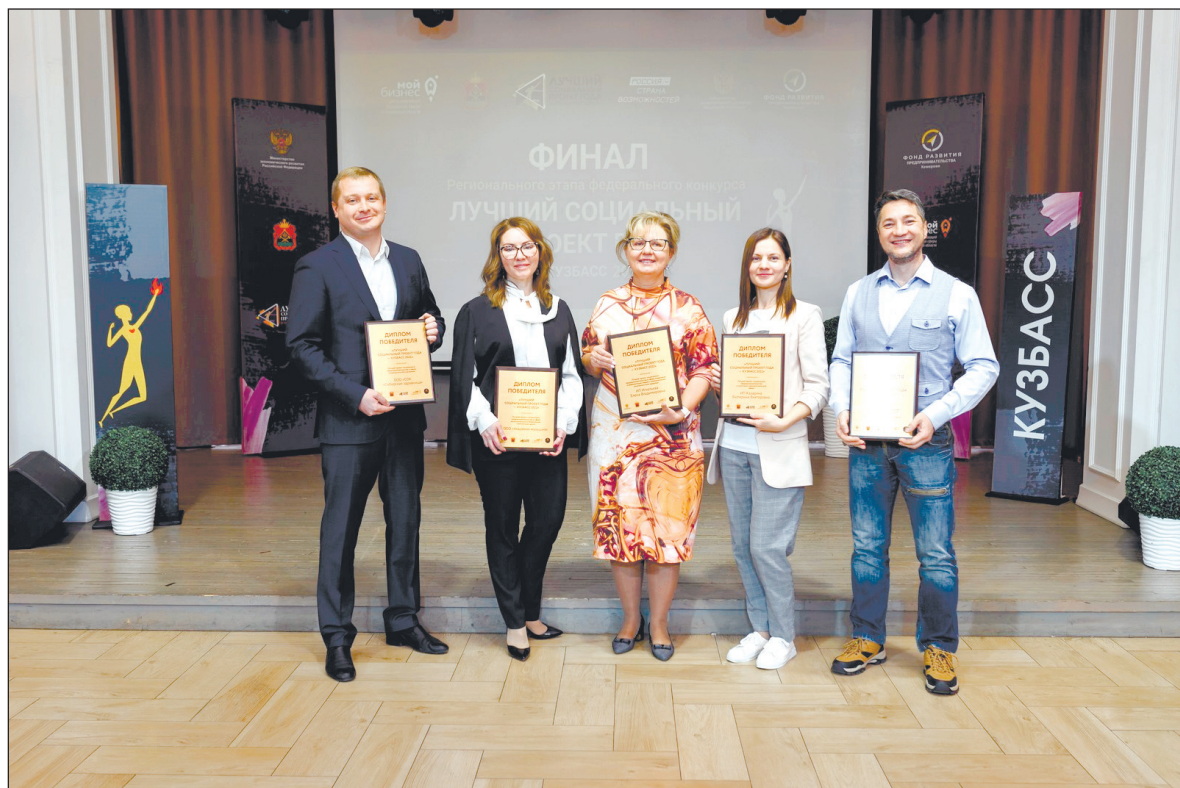
Победители конкурса «Лучший социальный проект-2022 в Кузбассе».

«В первую очередь это даёт признание социальным предпринимателям, которые реализуют свои проекты,