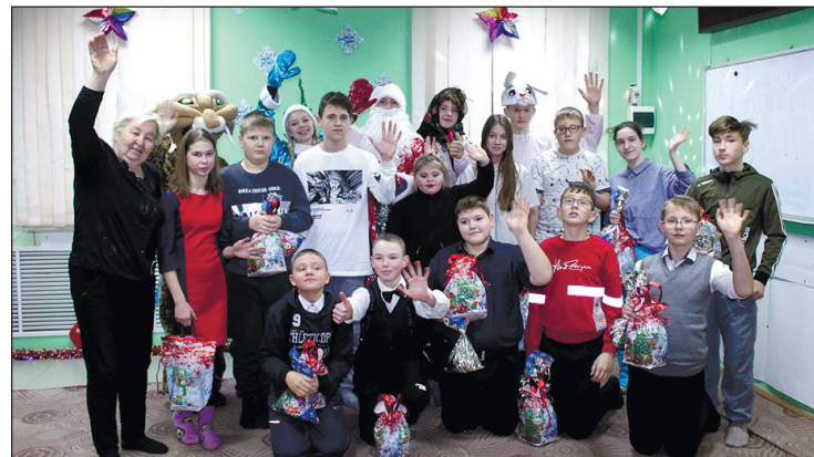
Новогодний праздник в Бабанакковском молодежном клубе «Бригантина».