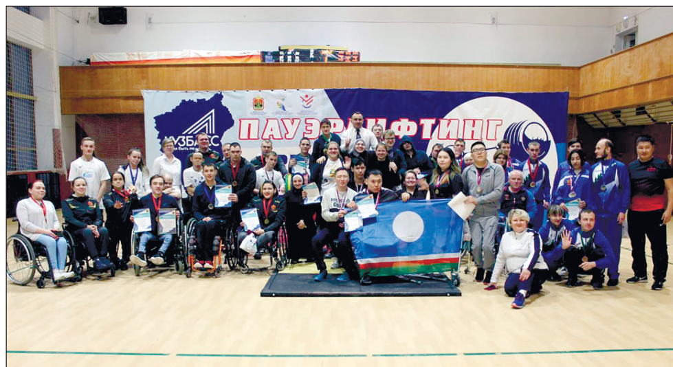
Общий снимок после окончания соревнований.