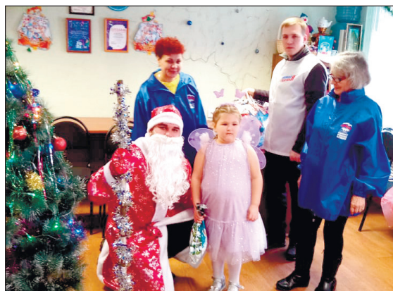
Дед Мороз выдает детям подарки от партии «Единая Россия».