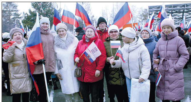
Члены Беловской организации ВОИ на митинге.

В местах проведения концертов «Своих не бросаем» работали пункты сбора гуманитарной помощи для бойцов-участников спецоперации. Собранные средства направят на закупку военного снаряжения, медикаментов, теплой одежды, квадрокоптеров и других необходимых вещей для мобилизованных и добровольцев Кузбасса, а также на гуманитарную помощь для мирных жителей Донбасса.