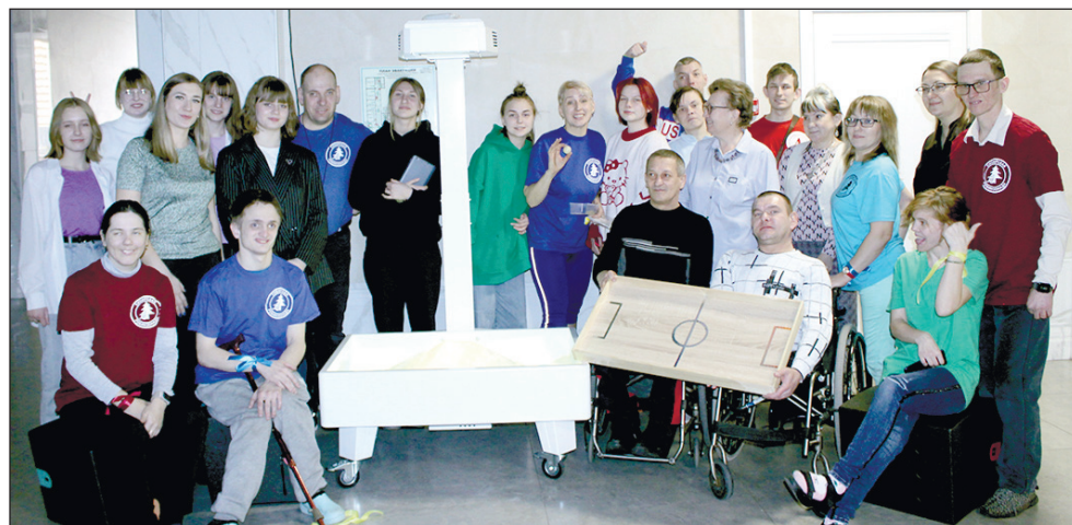
Снимок около интерактивной песочницы, в руках игра «Воздушный футбол», которую изготовили студенты, и подарили организации инвалидов.