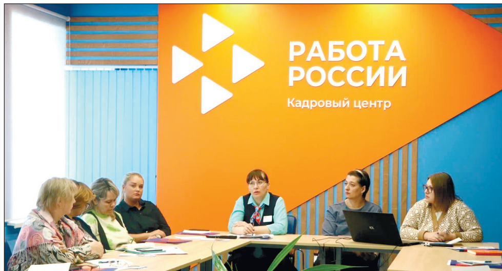
Круглый стол в кадровом центре «Работа России» города Кемерово по выполнению квоты для приема на работу граждан с инвалидностью.

и организацией (ИП), которая заключила с иной организацией (ИП) соглашение о трудоустройстве инвалидов (альтернативный способ выполнения квоты).