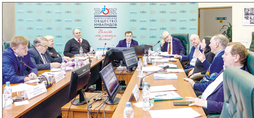
На заседании Президиума идет обсуждение итогов работы центрального аппарата ВОИ за прошлый год.

этом году должны пройти учредительные конференции в республиках по созданию двух региональных организаций и более десяти местных. Решение будет вынесено на голосование Центрального правления ВОИ.