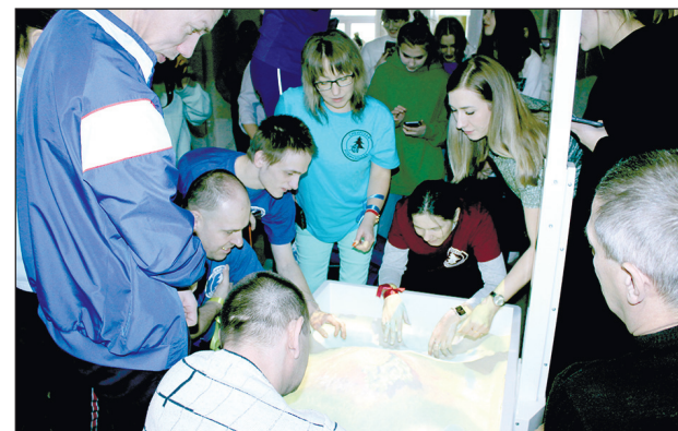
Для членов организации ВОИ была продемонстрирована интерактивная песочница.