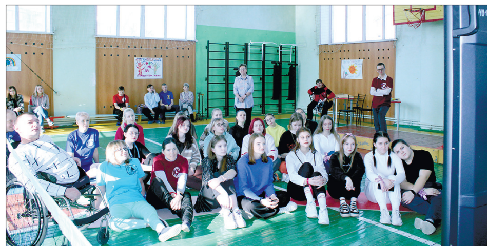
С огромным интересом все присутствующие посмотрели видео и фото о «Сибирской Робинзонаде», сплавах по рекам.