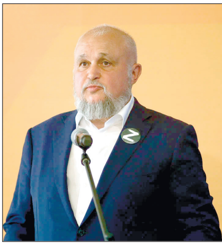
Губернатор Сергей Цивилев.

А 23 февраля Сергей Цивилев выступил с поздравительной речью.