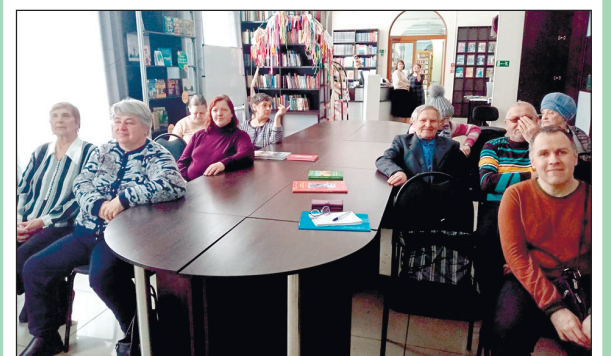
Члены Междуреченской организации ВОИ на заседании в клубе «Исток».

В этот раз темой встречи была беседа о коренных жителях Сибири шорцах. Сотрудники библиотеки рассказали о традициях и обычаях сибирского народа, особенностях уклада их жизни в современном мире. Завершилось мероприятие веселой викториной.